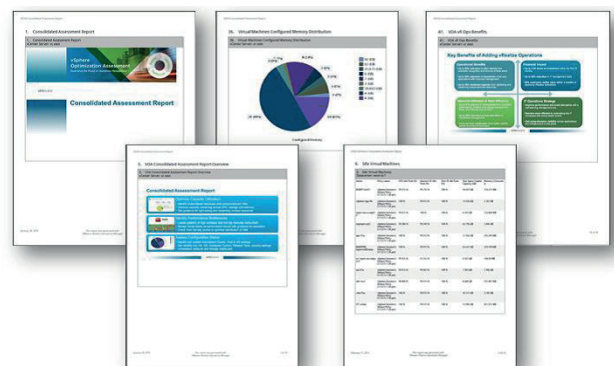
Der umfassende Report im Rahmen der Assessments gibt Ihnen eine detaillierte Auskunft über Ihre virtuelle Infrastruktur.