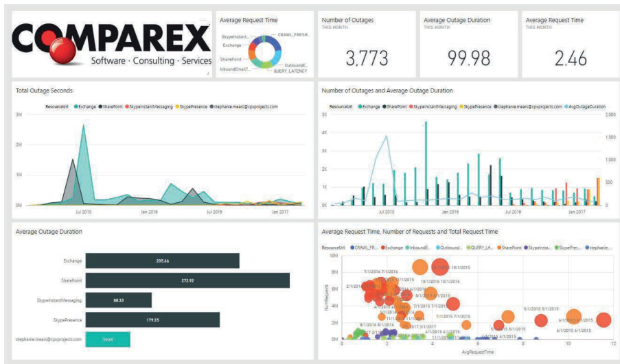
Tableau de bord de l'état de santé

En tant que caractéristique du module de support, il garantit une transparence totale de la disponibilité d'Office 365 en présentant :